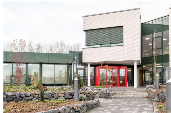
Hauptsitz der PHW-Gruppe in Rechterfeld / Niedersachsen.